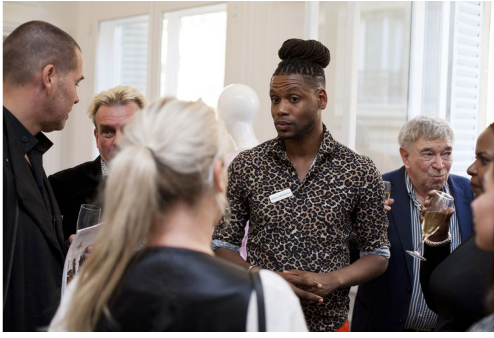
Het Atelier Néerlandais werd donderdag geopend.

Het is niet altijd eenvoudig om de weg te vinden op de Franse markt, ook door de aanzienlijke cultuurverschillen. 'De Franse humor is heel verbaal, je ziet vaak stripfiguren met enorme tekstballonnen. Visuele humor zie je heel weinig', zegt Kolk. Ook is Frankrijk verfijnder dan Nederland. 'In de strip Single, die onder meer in het AD verschijnt, teken ik een vrouw voor wie iedereen dekking moet zoeken als ze ongesteld is. Dat vinden ze in Frankrijk helemaal niet kunnen.'